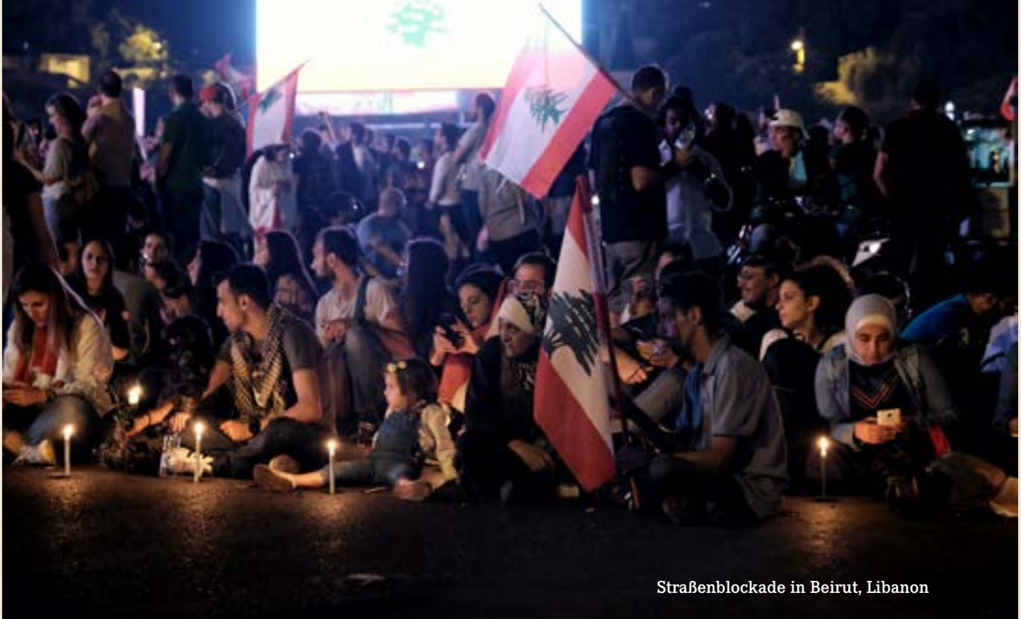
Straßenblockade in Beirut, Libanon

drücklich dafür, dass Arbeiter*innen und Jugendliche ihre eigenen Komitees und Organisationen schaffen, um in der Lage zu sein, die notwendigen Schritte, um die Proteste fortzusetzen und zum Erfolg zu machen, demokratisch zu diskutieren und zu entscheiden.