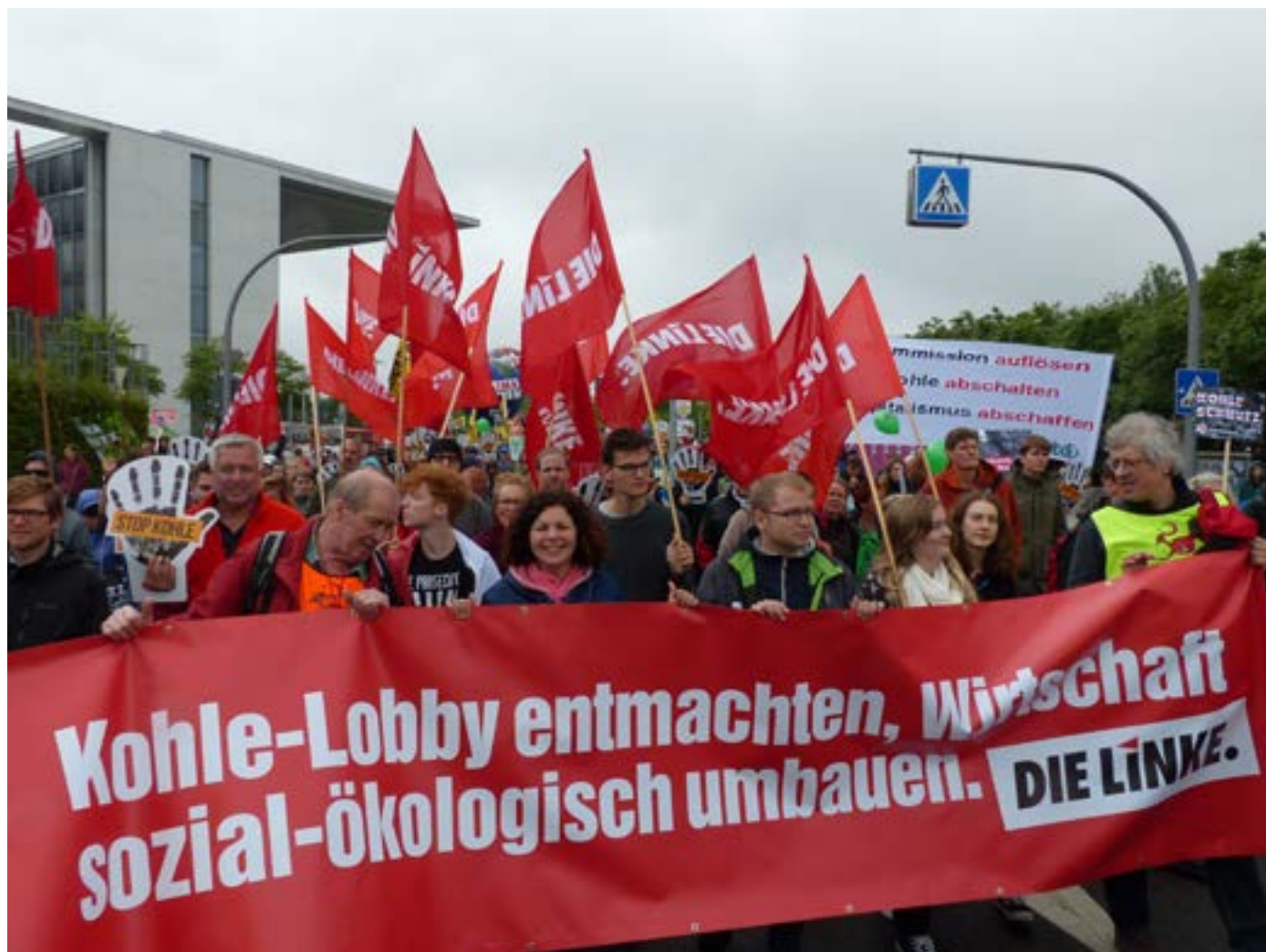
Stop-Kohle-Demo Berlin, 2018

vorschlägen zu drücken, um bürgerliche Regierung in Wartestellung zu spielen. Da konnte so ein Plakat nur als missglückte Selbstironie verstanden werden.